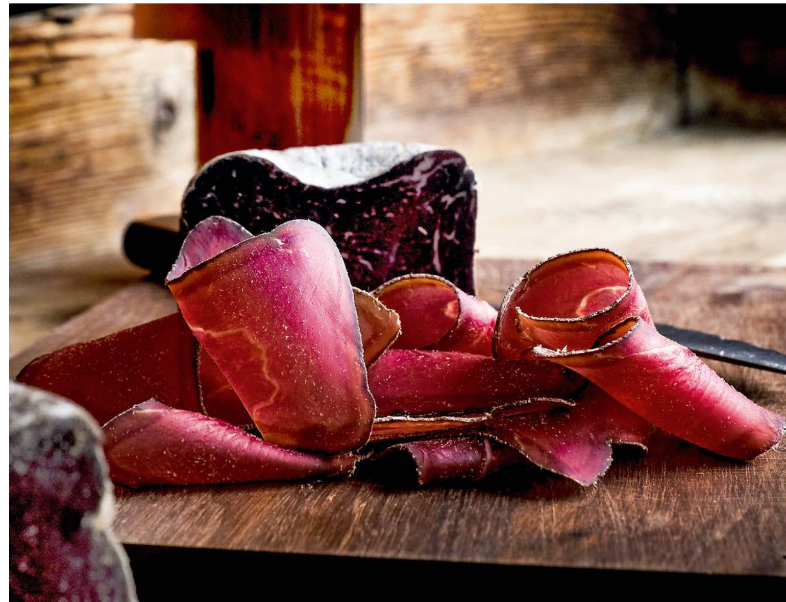
Das Bindenfleisch vom AlpenHirt wird ohne Pökelsalz hergestellt. Eine Lake aus Rotwein und Gewürzen verfeinert das Fleisch.